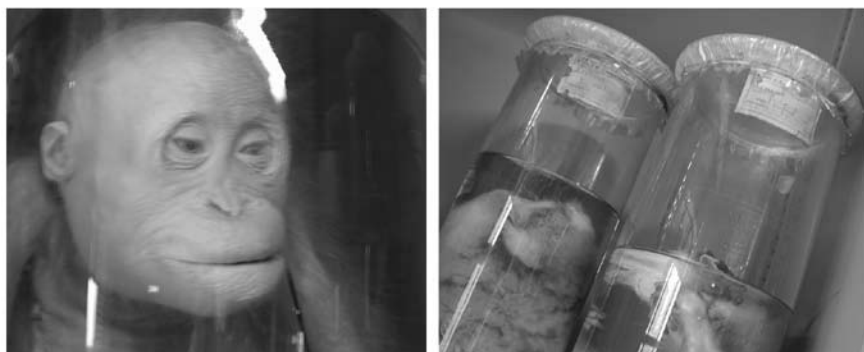
Fig. 5. Giovane di orango e adulti di Eulemur fulvus rufus (Museo "G. Sergi").

E' bene notare che nell'attuale catalogazione è stata utilizzata una nomenclatura vincolata alle scarse informazioni disponibili sui reperti più che alle più recenti revisioni tassonomiche (Groves, 2005). Data la difficoltà di riconoscere con dovuta certezza i ranghi tassonomici più di dettaglio dalla sola morfologia cranica, il livello di genere è stato usato pragmaticamente per raggruppare le forme principali. In questo contesto ad esempio il genere Cercopithecus include Chlorocebus , il genere Papio include Mandrillus , il genere Hylobates include Bunopithecus , Nomascus e Symphalangus e il genere Pongo è monospecifico. I principali gruppi neotropicali sono elevati al rango di famiglia (Atelidae, Pitheciidae, Cebidae), in accordo con dati molecolari (Chaves et al., 1999; Horovitz et al., 1998; Schneider et al., 2001; Von Dornum & Ruvolo, 1999) e biologici (Harvey & Clutton-Brock, 1985). I Callitrichidae sono interpretati secondo il medesimo rango tassonomico, data la loro particolare struttura e individualità biologica, sebbene recentemente siano inclusi in Cebidae (Groves, 2005).