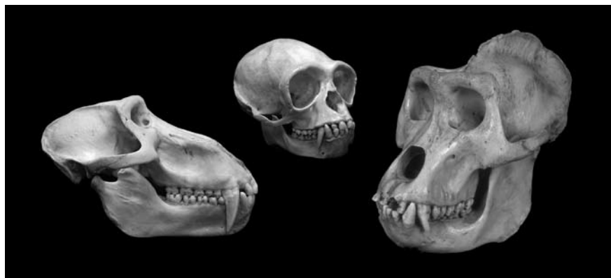
Fig. 4. Cranio di Papio , Hylobates , (Museo "G. Sergi") e Gorilla (Museo "G.B. Grassi").

modo il cranio). Il 20% presenta qualche danno minore, e solo il 6% risulta gravemente danneggiato o incompleto. Per quanto riguarda la distribuzione per età, il 53% degli esemplari sono adulti, il 19% subadulti, il 17% giovanili, e il restante 11% infantili (in funzione del numero di molari al piano di masticazione, da 3 a 0 rispettivamente). L' Allegato I riporta il catalogo completo della collezione osteologica. Considerata la scarsa numerosità campionaria dei vari taxa rappresentati, e la situazione di incertezza tassonomica, la collezione ha soprattutto un ruolo didattico e divulgativo. Per quanto riguarda la ricerca, le attuali condizioni permettono solo indagini esplorative o descrittive (e.g. Bruner et al., 2004).