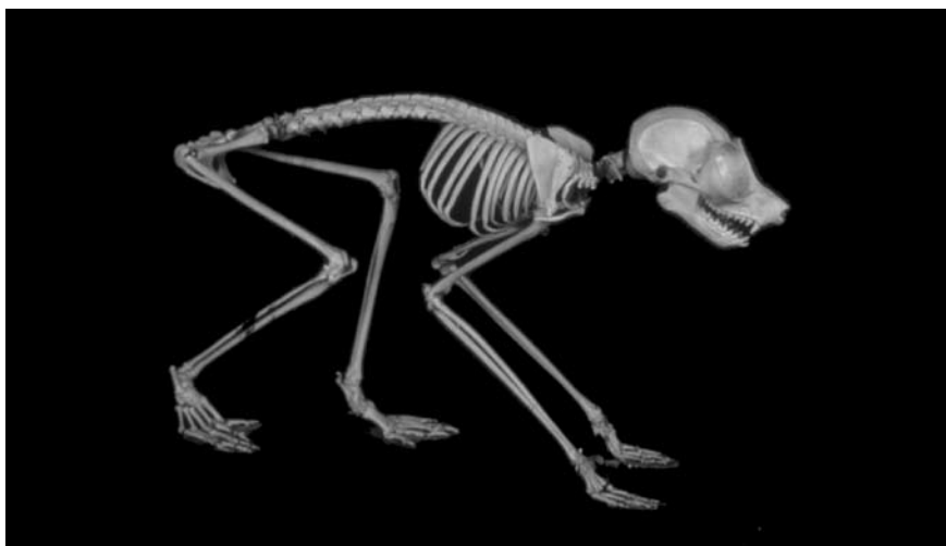
Fig. 2. Scheletro completo di Loris tardigradus (Museo "G. B. Grassi").

Gli esemplari della collezione osteologica sono in genere in ottimo stato di conservazione e anatomicamente completi (considerando in particolar